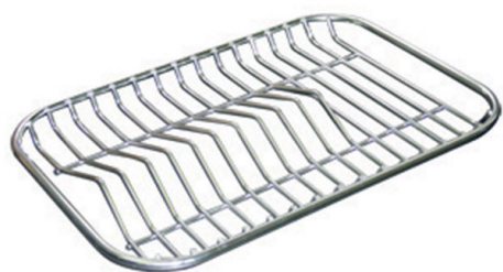
Grille porte-assiettes inox 8100 280