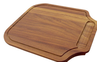
Planche de découpe en bois Iroko 8655 000