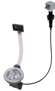
Vidange automatique LIRA 8407 103