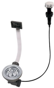
Vidange automatique 8407 100