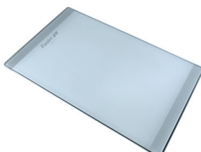
Planche de découpe en verre 8631 300