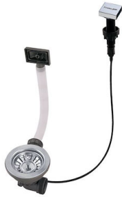
Vidange automatique LIRA 8407 102